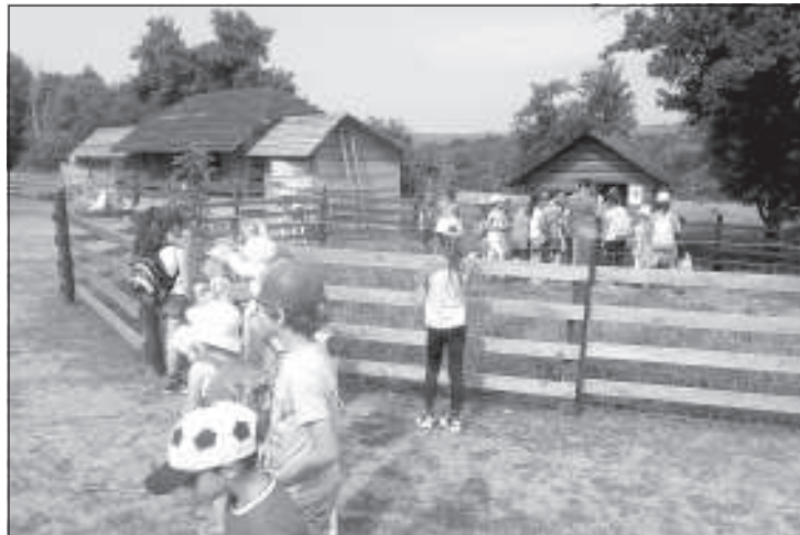
Na Mini farme v Lubine

19.6.2015 – Deň rodiny – tradičné popoludnie pre deti a ich rodiny (upevňovanie vzťahov, tvorivé aktivity, skákací hrad, Minie Mouse a samozrejme opekačka). Touto peknou spoločnou akciou sme ukončili aktivity školského roka 2014/2015 - ZŠ a MŠ