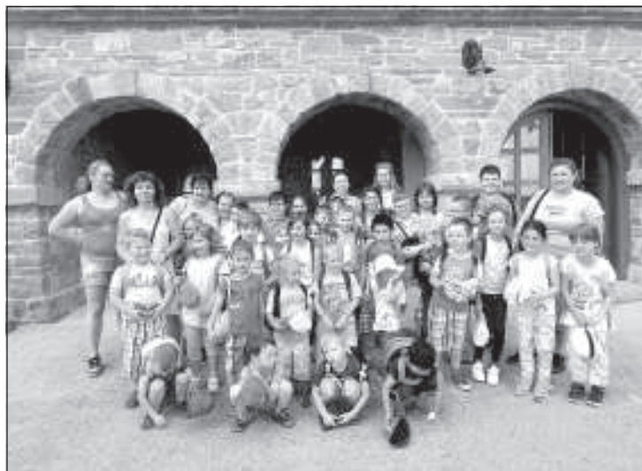
Pri Holubyho chate