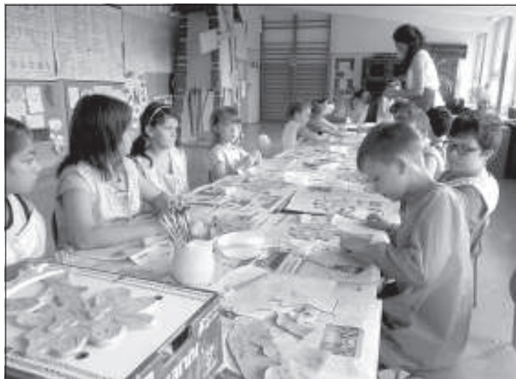
V keramickej dielni