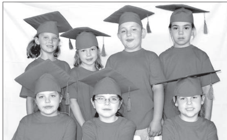
Absolventi materskej školy.