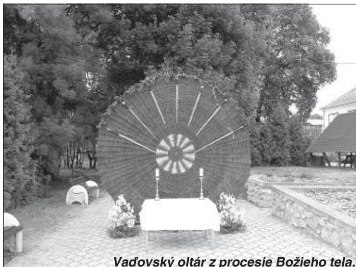
Vaďovský oltár z procesie Božieho tela.