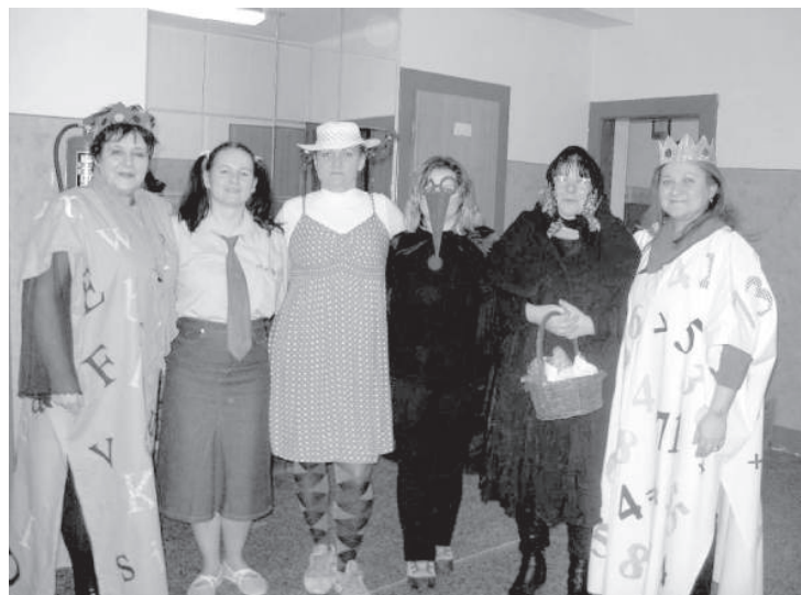
Veselý karneval mali aj dospeláci. Písmenková a číselková kráľovná, Pipi dlhá punčocha, zväzáčka, čierna vrana a babka bylinkárka.