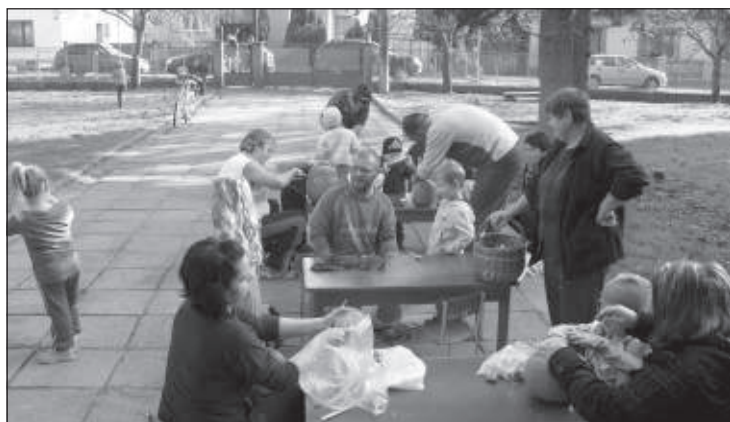
Tvorenie z tekvic „Pán svetlonos“