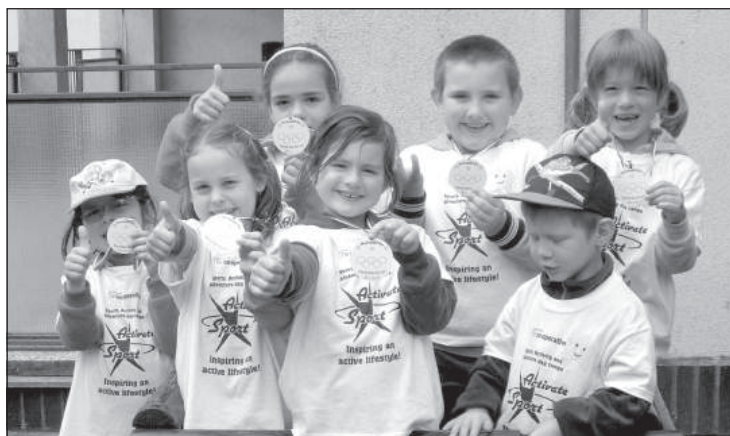
Olympiáda v Starej Turej