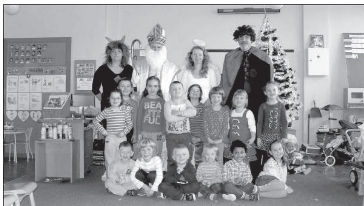
Mikuláš v materskej škole