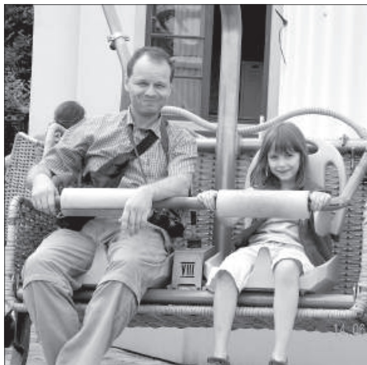
14.6. 2014 - Výlet do family parku v Rakúsku