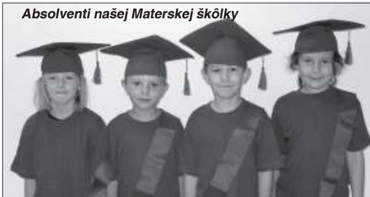
Absolventi našej Materskej škôlky

vé, hravé... a z čoho sa tešili? Predsa z toho, že školu majú a zo všetkého, čo v nej prežívajú... Neveríte? Tak počúvajte... Školský rok 2012/2013 sa začal tak, ako je zvykom – slávnostným otvorením, imatrikuláciou prvákov a pomalým zoznamovaním sa detí, zoznamovali sa medzi sebou navzájom a zoznamovali sa i s novými vedomosťami. Všetko prežívali spolu. Ale popri svojej radosťi, snažili sa nezabúdať ani na druhých, preto si v októbri – Mesiaci úcty k starším – pripravili darčeky a kultúrny program pre jubilujúcich občanov obce. Jesenné obdobie zavŕšili lampiónovým sprievodom „Plamienky vďaky“, ktorým sa chceli spolu s ostatnými poďakovať zemi za úrodu. V decembri sa opäť stretli i mimo školy – v Kultúrnom dome vo Vaďovciach, aby spoločne pozdravili vzácneho hosťa – Mikuláša, priniesol všetkým deťom darčeky a zabavili sa spolu pri vianočnom punči. Ešte pred vianočnými sviatkami deti stihli exkurziu vo firme OXYMAT, pripravili a odovzdali tu pozdrav formou projektu „OXYMAT očami detí“. So starým rokom sa naše deti rozlúčili prostredníctvom bábkového predstavenia, ktoré si sami vyrobili, zrežirovali i zahrali pre svojich mladších kamarátov z MŠ.