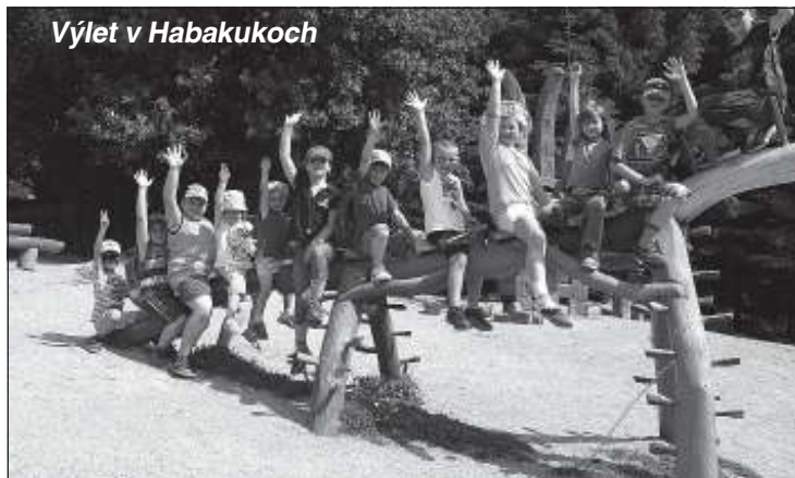
Výlet v Habakukoch