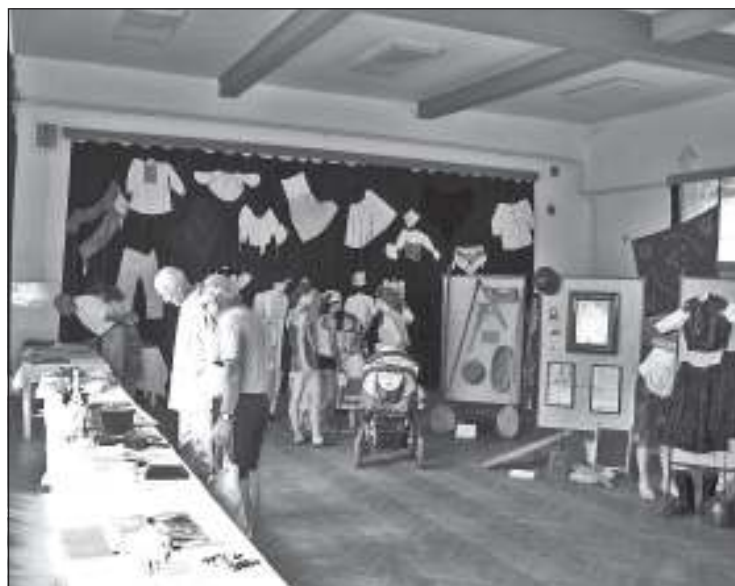
Výstava z dejín obce