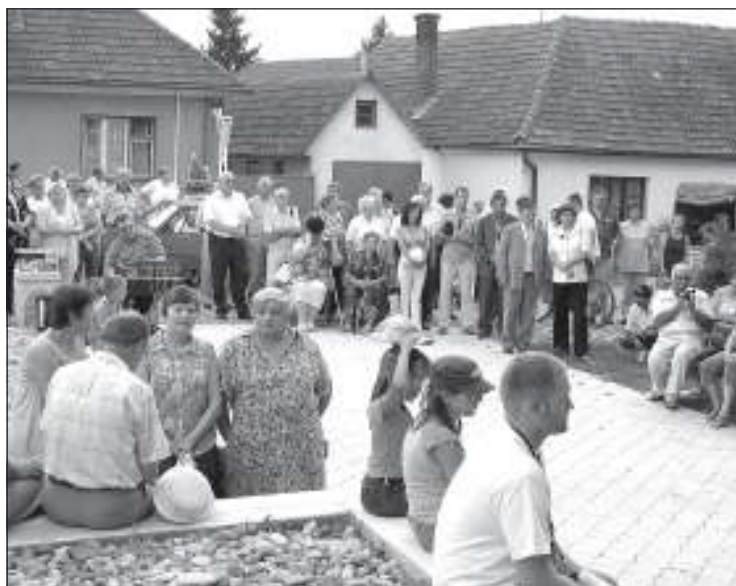
Oslavy v parku v centre obce